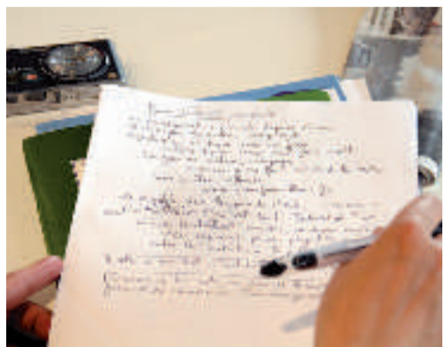
Clément, lycée Poncelet de Saint-Avoid

Dernier regard sur les ateliers de sculpture sur bois et sur métal : deux pièces qui ne payaient pas de mine, mais où les étudiants expérimentent le travail du bois ou du métal et en font des œuvres originales.