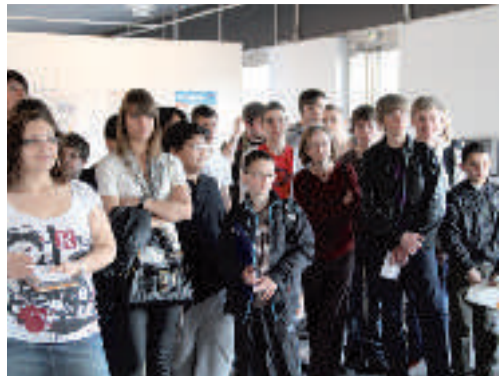
Une soixantaine d'élèves de l'académie Nancy-Metz a participé, fin avril, à ce «Cartable» dédié à l'image sous toutes ses formes. Organisée avec le concours de l'École Supérieure d'Art de Lorraine et Metz Métropole, cette rencontre a permis à ces jeunes de devenir, le temps d'une matinée, les envoyés spéciaux du Républicain Lorrain .