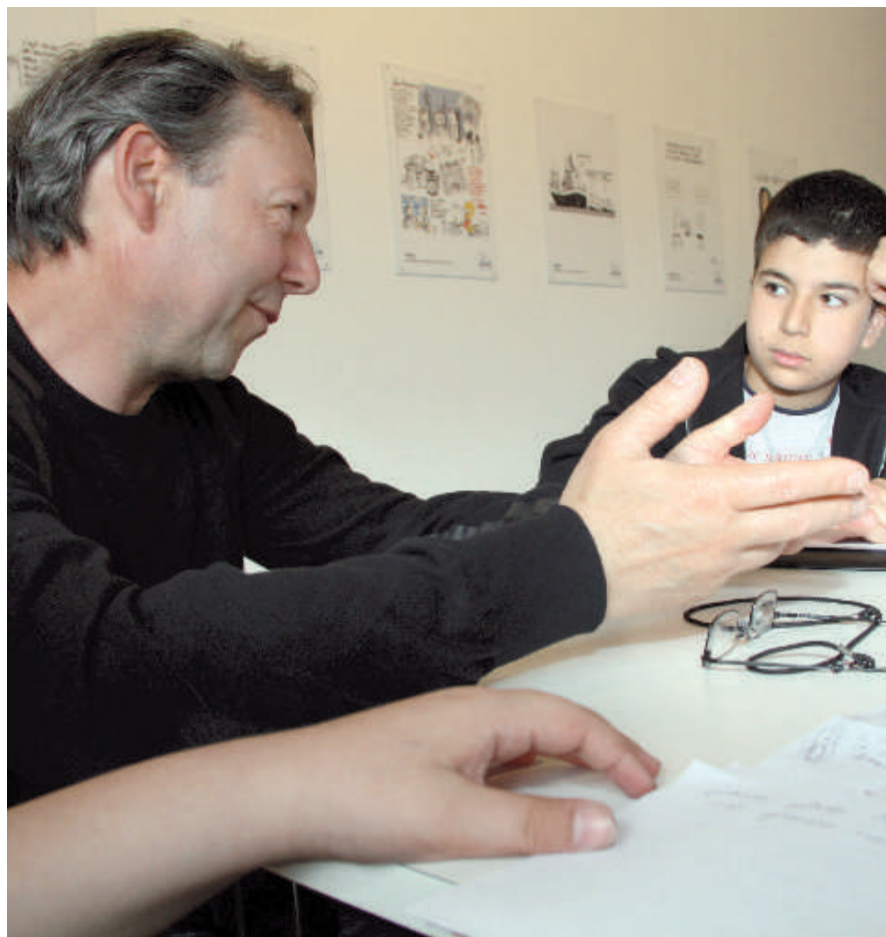
Les élèves de 3 e D.P.3h du collège Lucien-Pouguedé de Rémyilly

La rencontre avec le photographe d'art Jean-Luc Tartarin nous a permis de comprendre les différents sens que peut revêtir l'image. Omniprésente dans la société d'aujourd'hui, elle peut être consommable et disparaître rapidement ou durer et s'apparenter dans ce cas à une œuvre d'art.