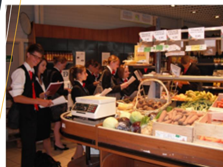
Marché BIO d'Essey-lès-Nancy