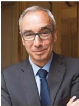
Jean Pisani-Ferry Commissaire général de France Stratégie

En dépit de la hauteur des barrières que les institutions économiques, sociales et politiques de notre pays opposent aux jeunes, le conflit entre générations n'a pas, aujourd'hui, d'existence politique visible. Les partis, syndicats ou associations qui structurent notre vie collective existaient presque tous il y a vingt ou trente ans, quand ce n'est pas beaucoup plus.