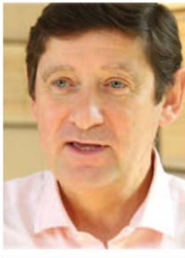
Patrick Kanner Ministre de la Ville, de la Jeunesse et des Sports

Un lieu commun circule : les jeunes seraient désintéressés des affaires de la cité, ils seraient repliés sur eux-mêmes, à l'écart de la vie collective. La première vertu de ce rapport est de tordre le cou à cette vision péjorative de la jeunesse. Une nation qui n'a pas confiance en sa jeunesse est une nation qui n'a pas confiance en son avenir. Nous devons retrouver fierté et optimisme, et cela passe entre autres par le fait de laisser toute sa place à la jeunesse.