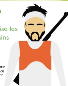
Martin Fourcade Biathlon

En randonnée, j'utilise les sentiers et les chemins et je rapporte mes déchets.