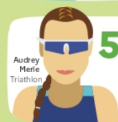
Audrey Merle Triathlon