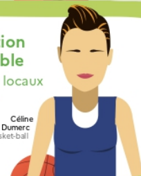
Céline Dumerc Basket-ball

J'achète des produits locaux et de saison et j'évite le gaspillage.