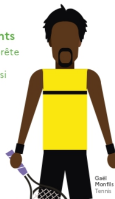
Gaël Monfilis Tennis