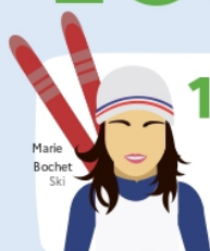
Marie Bochet Ski