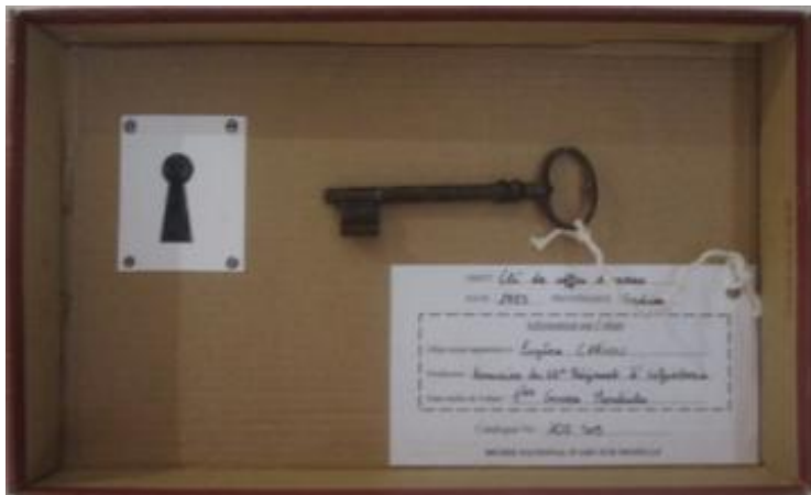
Devoir de mémoire : des objets « archéologiques »